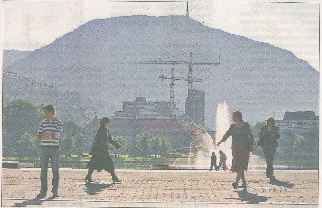
BYMILJØ: Eit aktivt nettverk for debatt og rådgjeving i by- og miljøutforming skal nå leggjast ned. Biletet er frå Festplassen i Bergen.

Eit sentralt kontor for formgjeving på Austlandet veit ikkje kva lokalklima på Vestlandet er